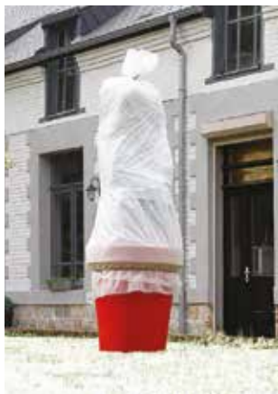
5€ 50 2 X 10 M VOILE HIVERNAGE NORTENE 30g/m 2 . Réf. 334624