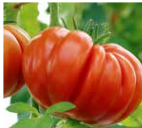
CŒUR DE BŒUF