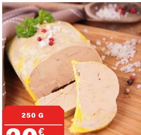
TABLE DE FÊTES

LA COOPÉRATIVE, PLUS PROCHE DE VOUS ET DE VOS GOÛTS